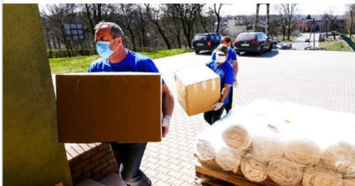
Quarantine Centres in 35 communities in Poland furnished by IKEA